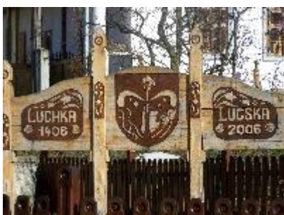
Pamätná tabuľa pri príležitosti 600 rokov od prvej zmienky