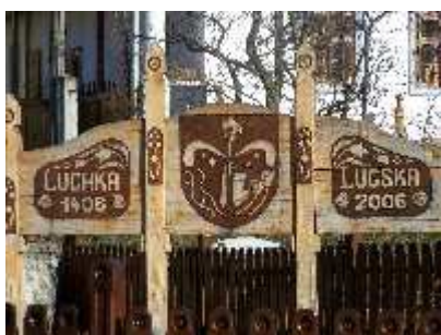
Pamätná tabuľa pri príležitosti 600 rokov od prvej zmienky