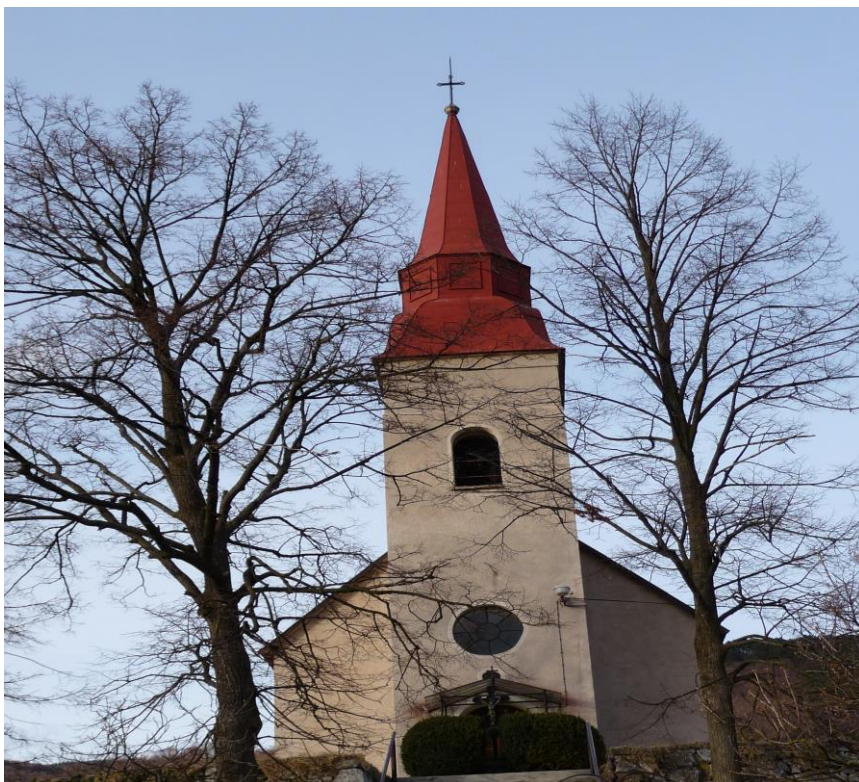
Kostol Reformovanej cirkvi