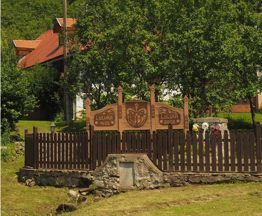
Pamätník oznamuje turistom, že prvá písomná zmienka o dedine pochádza z roku 1406