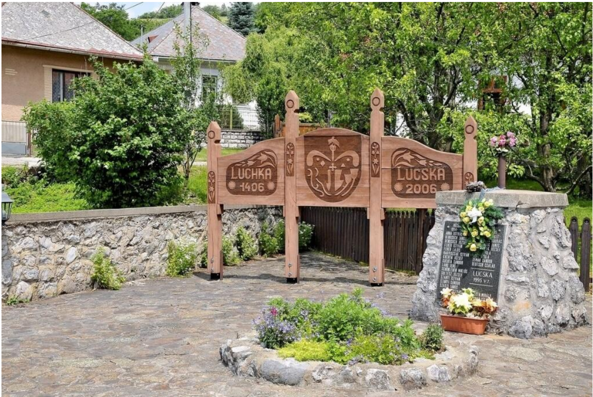
Pamätník obete vojny